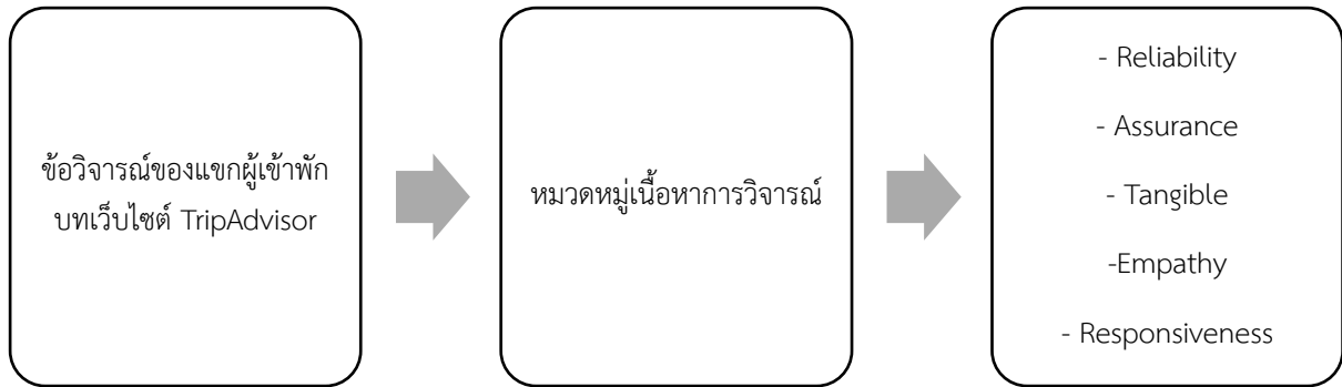
ภาพที่ 1 กรอบแนวคิดในการวิจัย

ร้องเรียน ได้แก่ ความน่าเชื่อถือ (Reliability) การตอบสนอง (Responsiveness) การให้ความมั่นใจ (Assurance) การเอาใจใส่ (Empathy) และด้านกายภาพ (Tangible)